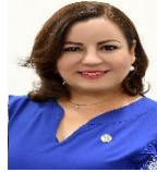
Bonnafoux Alcaraz Madeleine G.P.:PAN Entidad: Sonora Circ.: 1 Curul: C-057